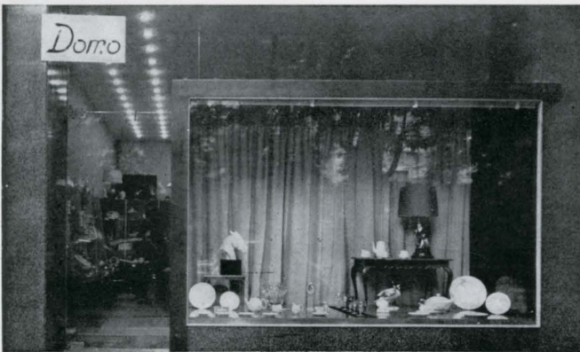
Vista del interior y de la fachada.